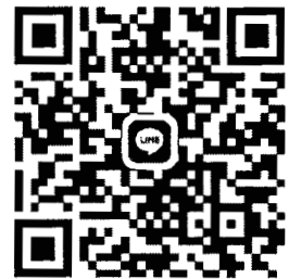
วิชาคอมพิวเตอร์

ให้นักเรียนติดตามข้อมูลข่าวสาร และประกาศจากศูนย์โอลิมปิกวิชาการ สอวน. มจพ. อย่างสม่ำเสมอ