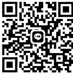
วิชาชีววิทยา