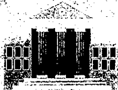
มหาวิทยาลัย

คือ คุณพัฒนาบุคลากรระดับปริญญาเอก เพื่อผลิตดุษฎีบัณฑิตที่มีความเชี่ยวชาญด้านการวิจัยเฉพาะด้าน โดยเน้นโจทย์วิจัยที่มาจากหน่วยงานภาครัฐ